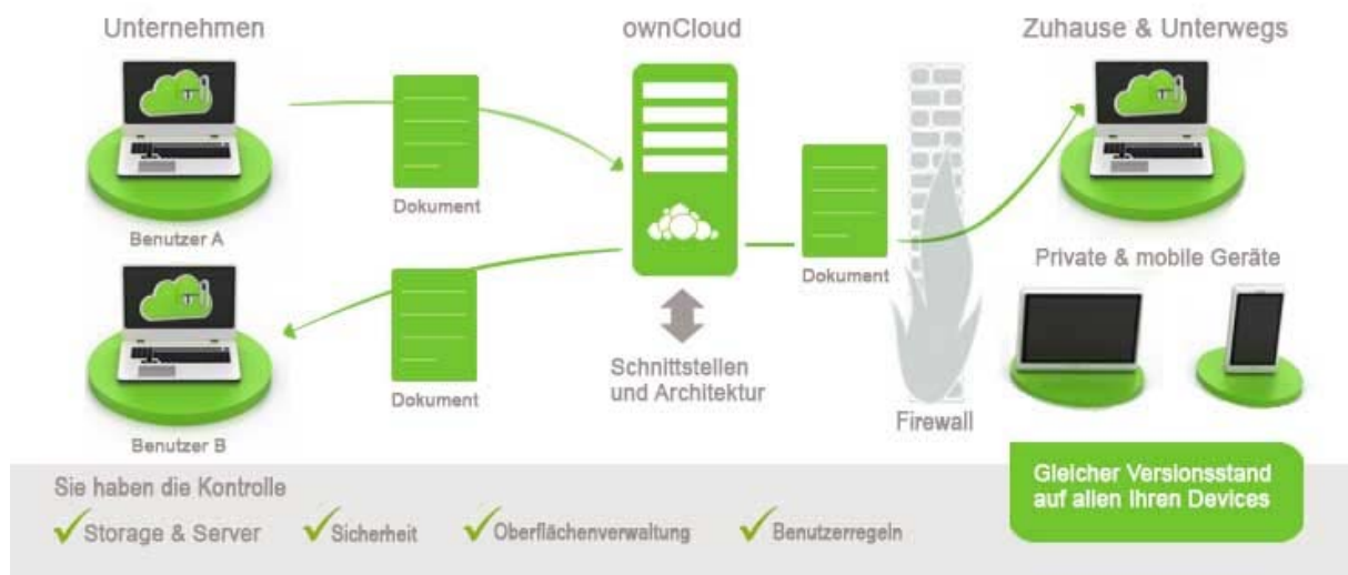
Abbildung 1: Beispiel Mittelstandslösung "Managed ownCloud"